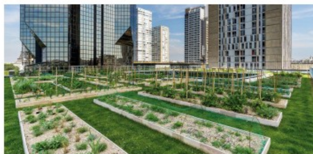
Huerto en altura en Le Cordon Blue, Paris