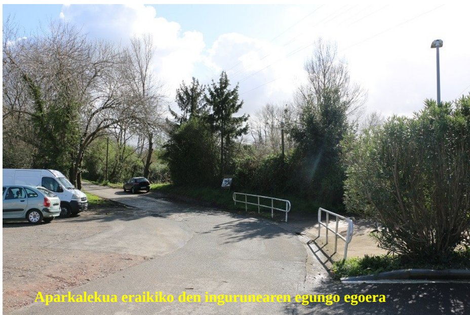
Aparkalekua eraikiko den ingurunearen egungo egoera

Lanak egiteko epea 4 hilabetekoa da, eta 361.638 euroko aurrekontua du. Beharrezko tramiteak egin ondoren, lanak uztailean has litezke.